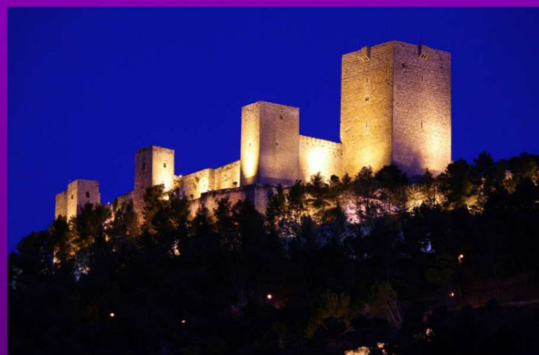
Tipo de Curso: Semipresencial. Fase Presencial: Jaén, 26 al 29 de septiembre de 2011