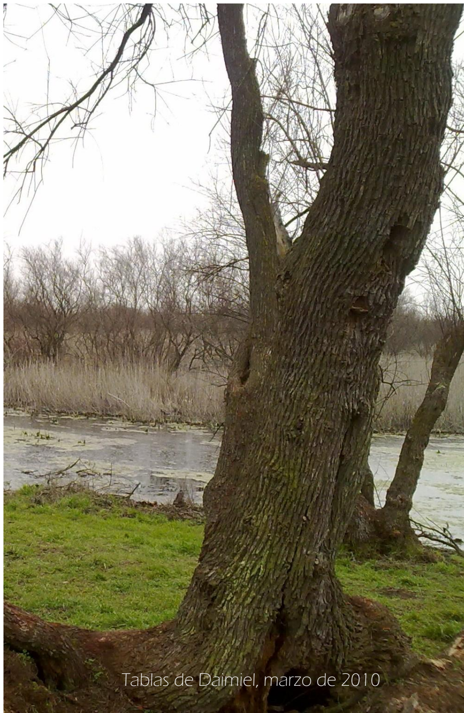
Tablas de Daimiel, marzo de 2010