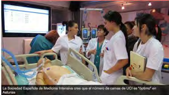
La Sociedad Española de Medicina Intensiva cree que el número de camas de UCI es "óptimo" en Asturias

Me gusta 0 | Twitter 0 | +1 0 | Imprimir | Deja tu comentario