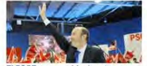
El PSOE, convencido de estar a menos de 9 puntos del PP

Iñaki Urdangarín implicó a la infanta Cristina en sus negocios turbios