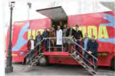
Camión informativo del trabajo de las UCI.

Barça, R.Madrid y Málaga se juegan la Champions en CANAL+ por solo 10,95 € al mes más IVA.