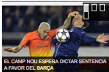
EL CAMP NOU ESPERA DICTAR SENTENCIA A FAVOR DEL BARÇA