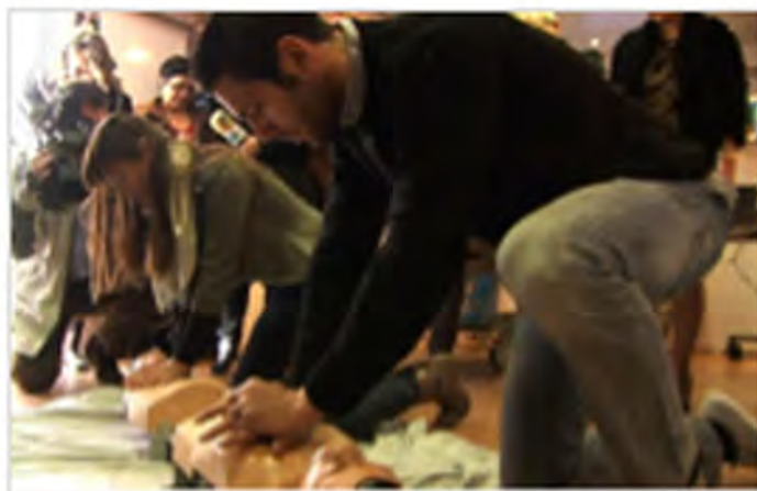
La reanimación cardiopulmonar aumenta entre un 12 y 25% la supervivencia de pacientes en parada cardíaca

La reanimación cardiopulmonar incrementa la supervivencia de los pacientes en parada cardíaca en un 12 por ciento si se aplican en el ámbito extrahospitalario y un 25 por ciento si son atendidos de manera intrahospitalaria, según datos presentados por la Sociedad Española de Medicina Intensiva y Unidades Coronarias (SEMICYUC) durante el transcurso de la Campaña 'UCI es Vida' en Logroño.