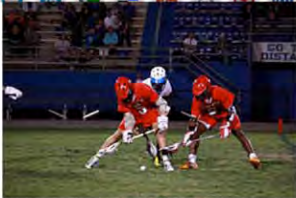
Imagen Azopka Blue Diarter Lacrosse