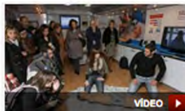
Los jugadores del Naturhouse practican con un muñeco ejercicio de resucitación.

La campaña continúa su recorrido de más de 2.800 kilómetros en Vitoria y terminará el viernes 26 en Málaga recorriendo las ciudades de Burdeos (Francia), durante la primera semana y Zaragoza, Girona, Castellón y Murcia; durante la segunda.