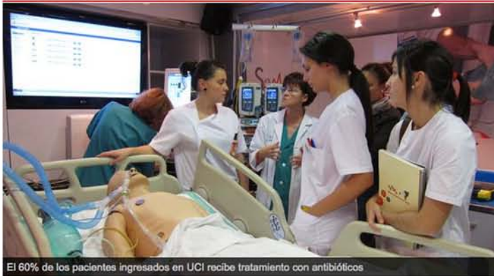
El 60% de los pacientes ingresados en UCI recibe tratamiento con antibióticos

Me gusta 0 Twitter 0 Imprimir Deja tu comentario