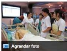
Agrandar foto El 60% de los pacientes ingresados en UCI recibe tratamiento con antibióticos