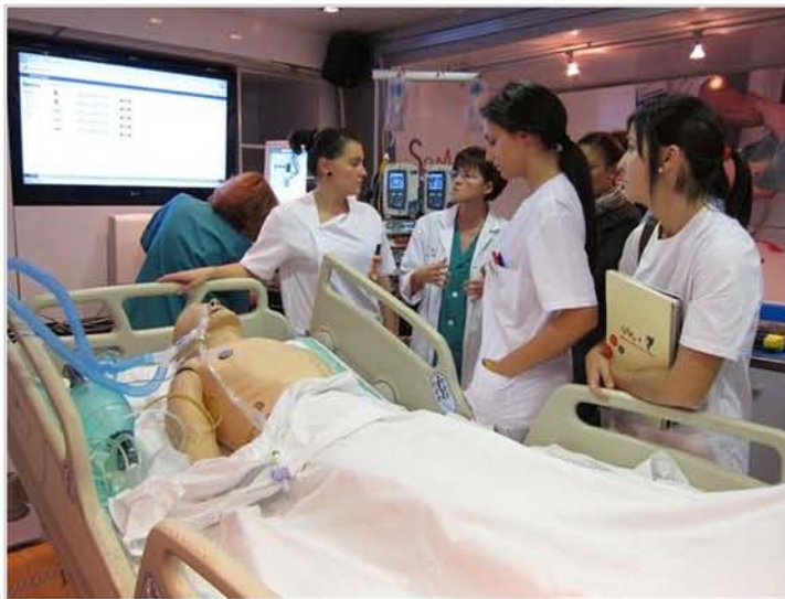
El 60% de los pacientes ingresados en UCI recibe tratamiento con antibióticos BARCELONA, 17 (EUROPA PRESS)

El 60 por ciento de los pacientes ingresados en alguna unidad de cuidados intensivos (UCI) recibe tratamiento con antibióticos en algún momento de su estancia, ha recordado este jueves la Sociedad Española de Medicina Intensiva, Crítica y Unidades Coronarias (Semicyuc).