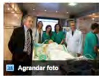
Agrandar foto El 90% de los casi 3.000 pacientes que ingresan anualmente en la UCI de Valdecilla ...

Valdecilla cuenta con "la cartera de servicios más grande de España" en Medicina Intensiva, según el jefe de Servicio SANTANDER, 15 (EUROPA PRESS)