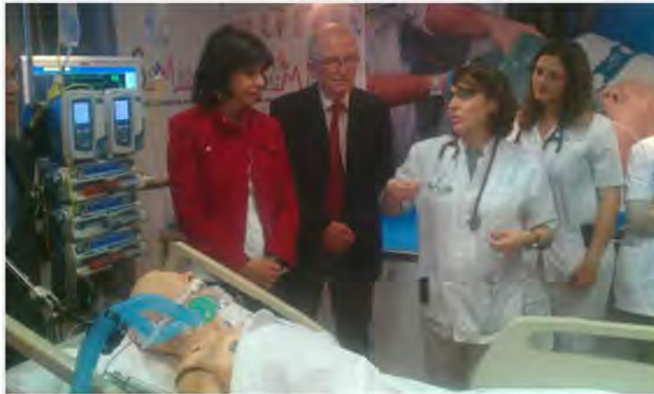
Valladolid acogerá el martes una campaña que trata de llamar la atención sobre el trabajo de los médicos en las UCI

El autobús de la campaña 'UCI es VIDA' llegará el martes, 9 de abril, a Valladolid para tratar de llamar la atención sobre el trabajo que realizan los médicos en las unidades de cuidados intensivos (UCI).