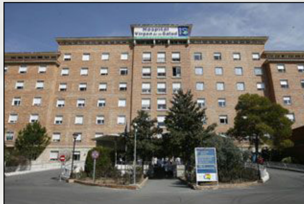
Hospital Virgen de la Salud